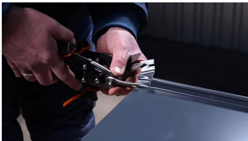
Einschnitt des Stehfalzprofils.