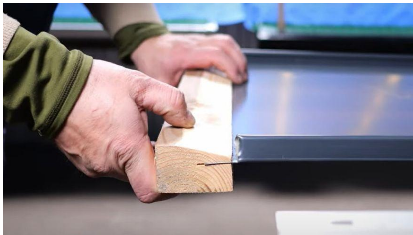
Verwendung der Dachlatte zum falzen.